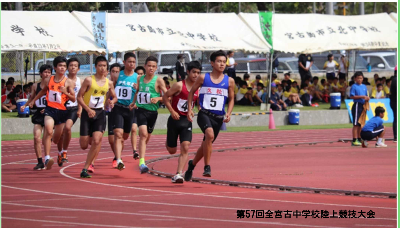
第57回全宮古中学校陸上競技大会

令和元年度 外国語指導助手 (ALT)委嘱状交付式 令和元年度 全国学力・学習状況調査の結果